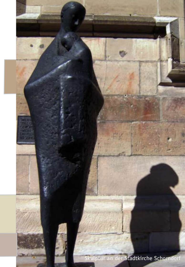
Skulptur an der Stadtkirche Schorndorf

Spendengelder müssen dem Spendenzweck zeitnah zugeführt werden. Darauf achtet das Finanzamt.