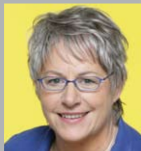
Heiderose Berroth MdL