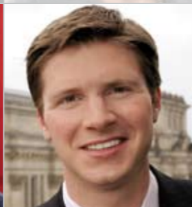
Florian Toncar MdB